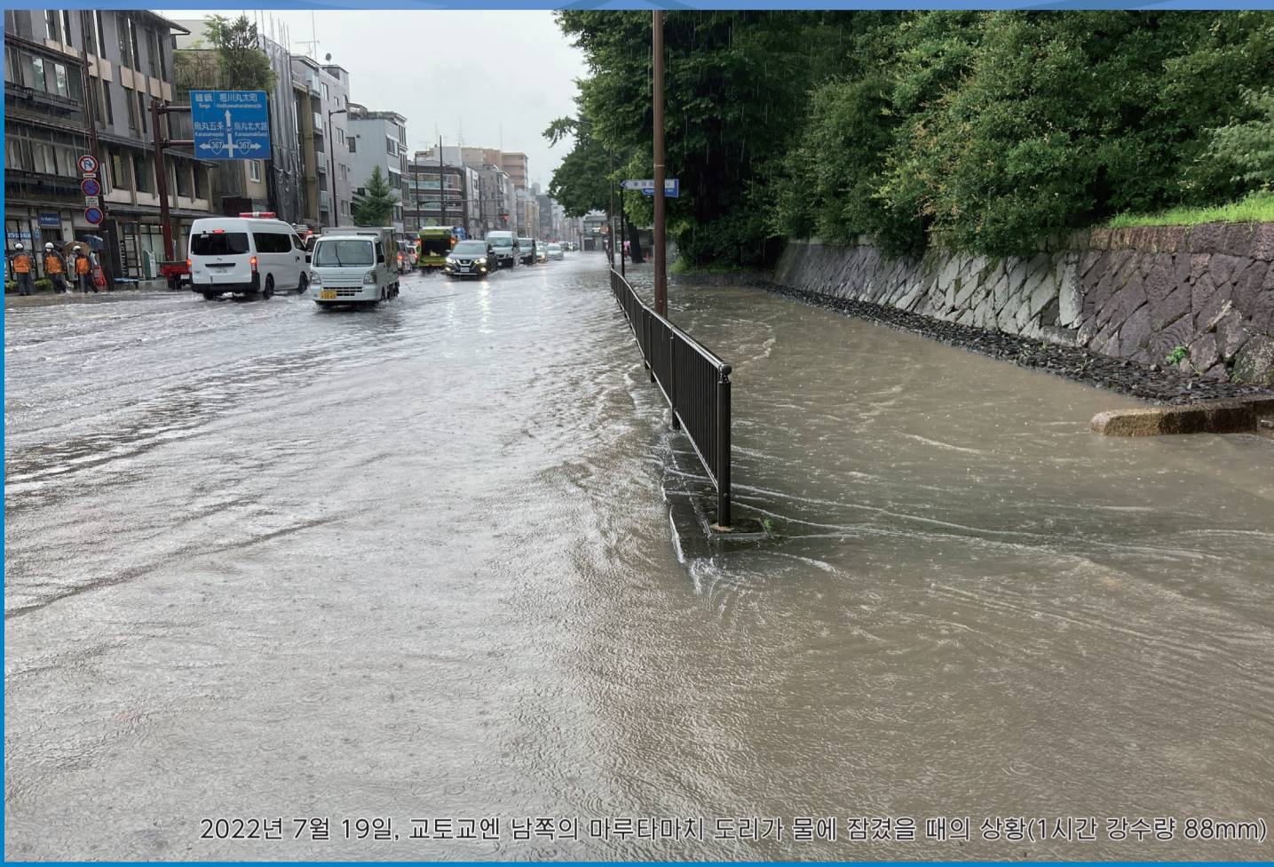
2022년 7월 19일, 교토역 남쪽의 이부타에서 무라카미가에 경정수 펌의 상류(시원량 수위 88mm)

교토 시내 내수 해저드맵에 대하여 「교토 시내 내수 해저드맵」은 예상 가능한 최대 규모의 강우*로 인해 하수나 수거가 범람할 경우의 침수 범위와 깊이 등의 정보를 정리한 지도입니다. 이 해저드맵은 시인(여러분)이 평소부터 대비하고, 호우 시 적절한 피난 행동을 취할 수 있도록 작성되었습니다. ※이 비는 약 1000년에 한 번 정도 오는, 매우 강한 비입니다(147mm/h). 하수도는 약 10년에 한 번 정도 오는 비(62mm/h)를 기준으로 만들어져 있지만, 이 비는 그 기준보다 훨씬 많은 비입니다.